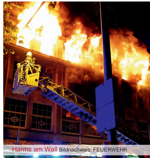
Harms am Wall

Eine neue Herausforderung war in diesem Jahr die Versorgung von Flüchtlingen. Hierbei war die