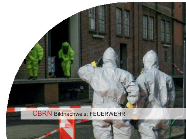
CBRN Bildnachweis: FEUERWEHR

Mit solch großer Anzahl von Kindern und Erwachsenen hatte keiner gerechnet. Über 300