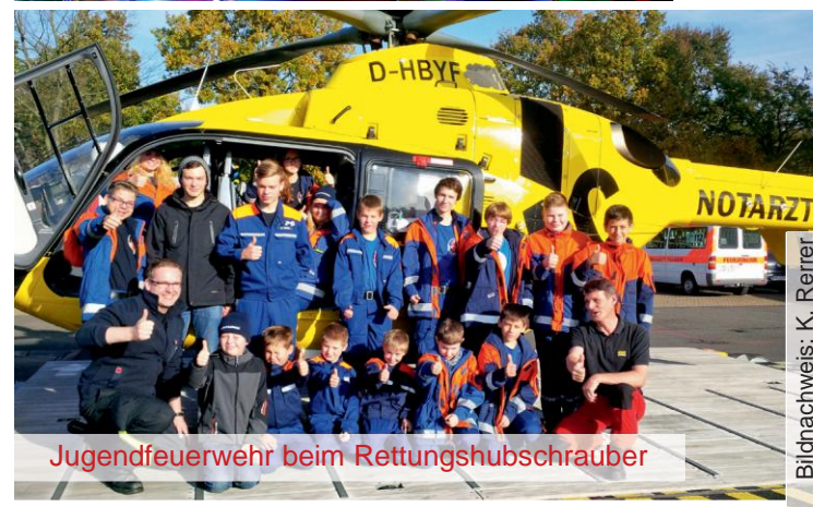
Jugendfeuerwehr beim Rettungshubschrauber